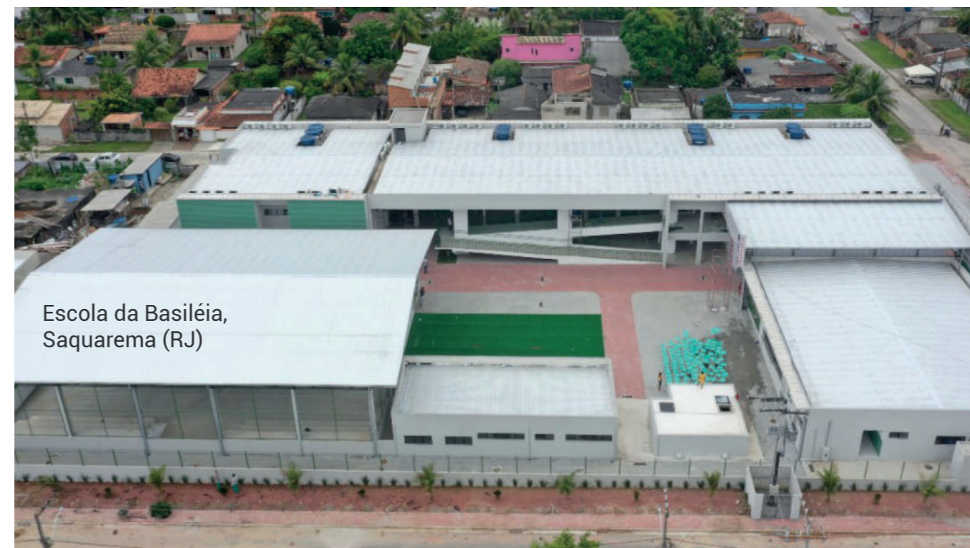
Escola da Basiléia, Saquarema (RJ)

A Ônix Serviços e Engenharia, fundada no ano 2000, é uma empresa especializada no ramo da construção civil, operação de equipamentos públicos e limpeza urbana.