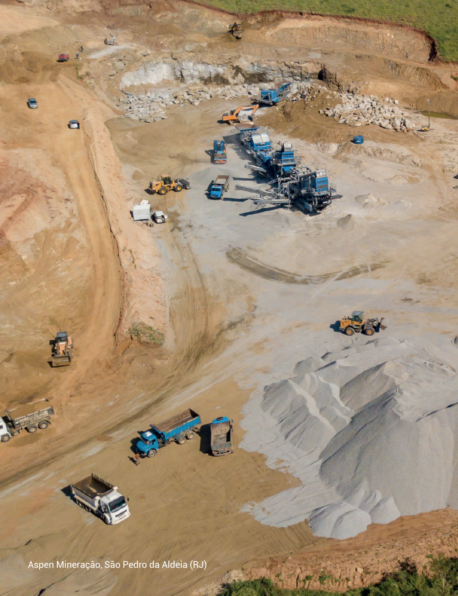
Aspen Mineração, São Pedro da Aldeia (RJ)