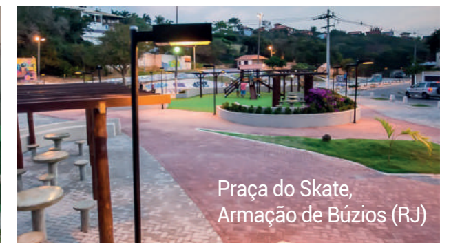
Praça do Skate, Armação de Búzios (RJ)