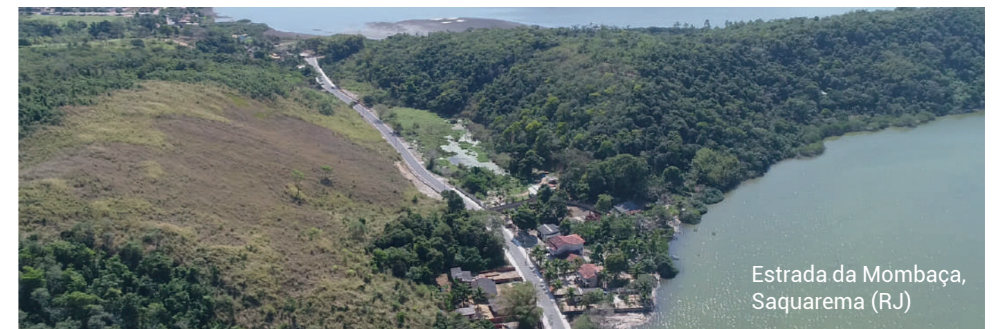
Estrada da Mombaça, Saquarema (RJ)