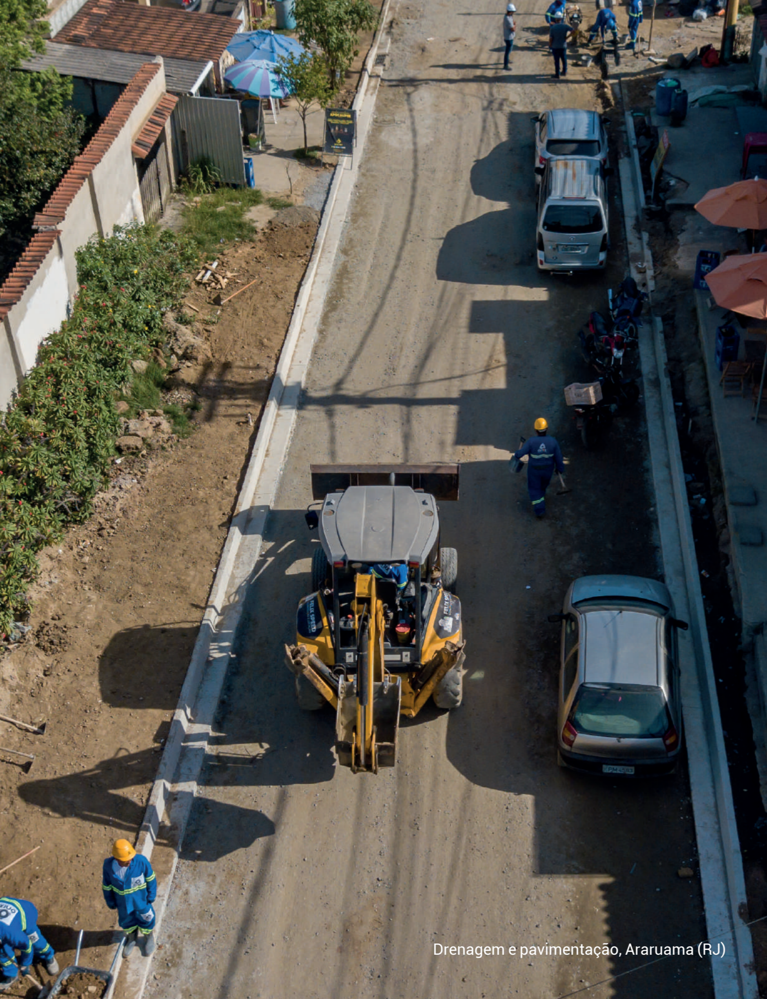
Drenagem e pavimentação, Araruama (RJ)