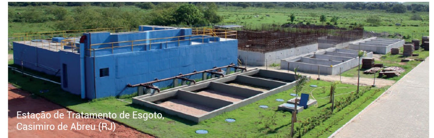
Estação de Tratamento de Esgoto, Casimiro de Abreu (RJ)