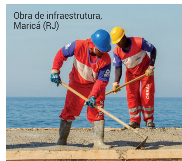
Obra de infraestrutura, Maricá (RJ)

Realiza com excelência obras de drenagem pluvial, pavimentação, esgotamento sanitário, obras de arte, infraestrutura e conservação urbanística.