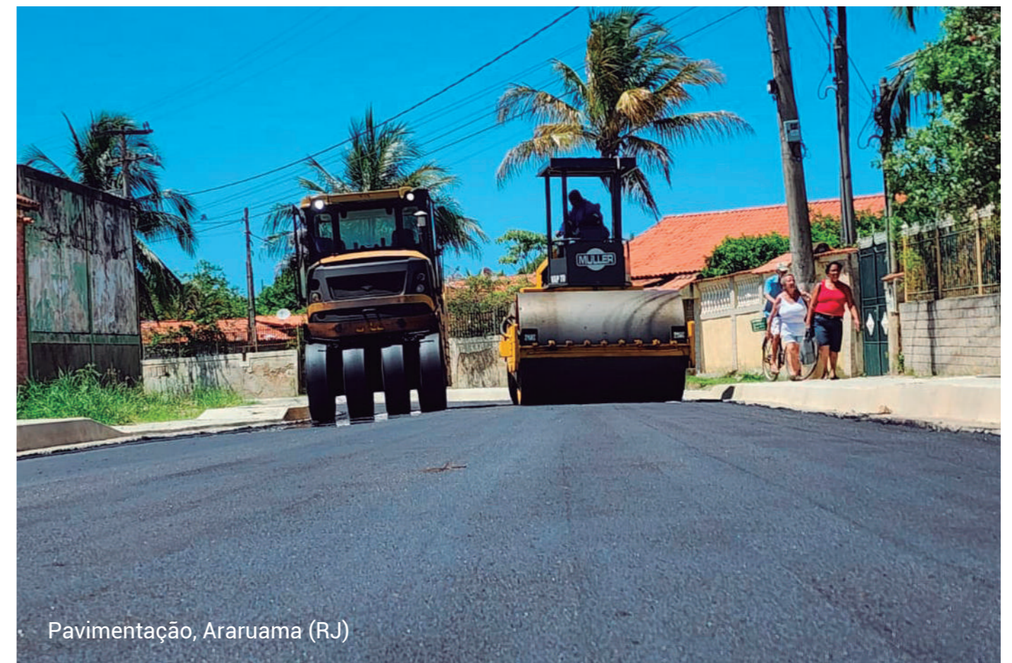
Pavimentação, Araruama (RJ)

A Ônix faz parte de um grupo que possui pedreiras, concreteiras, usinas de asfalto e empresa de locação de equipamentos, o que resulta em menores preços para o cliente, além de garantia da qualidade dos insumos e compromisso com os prazos .