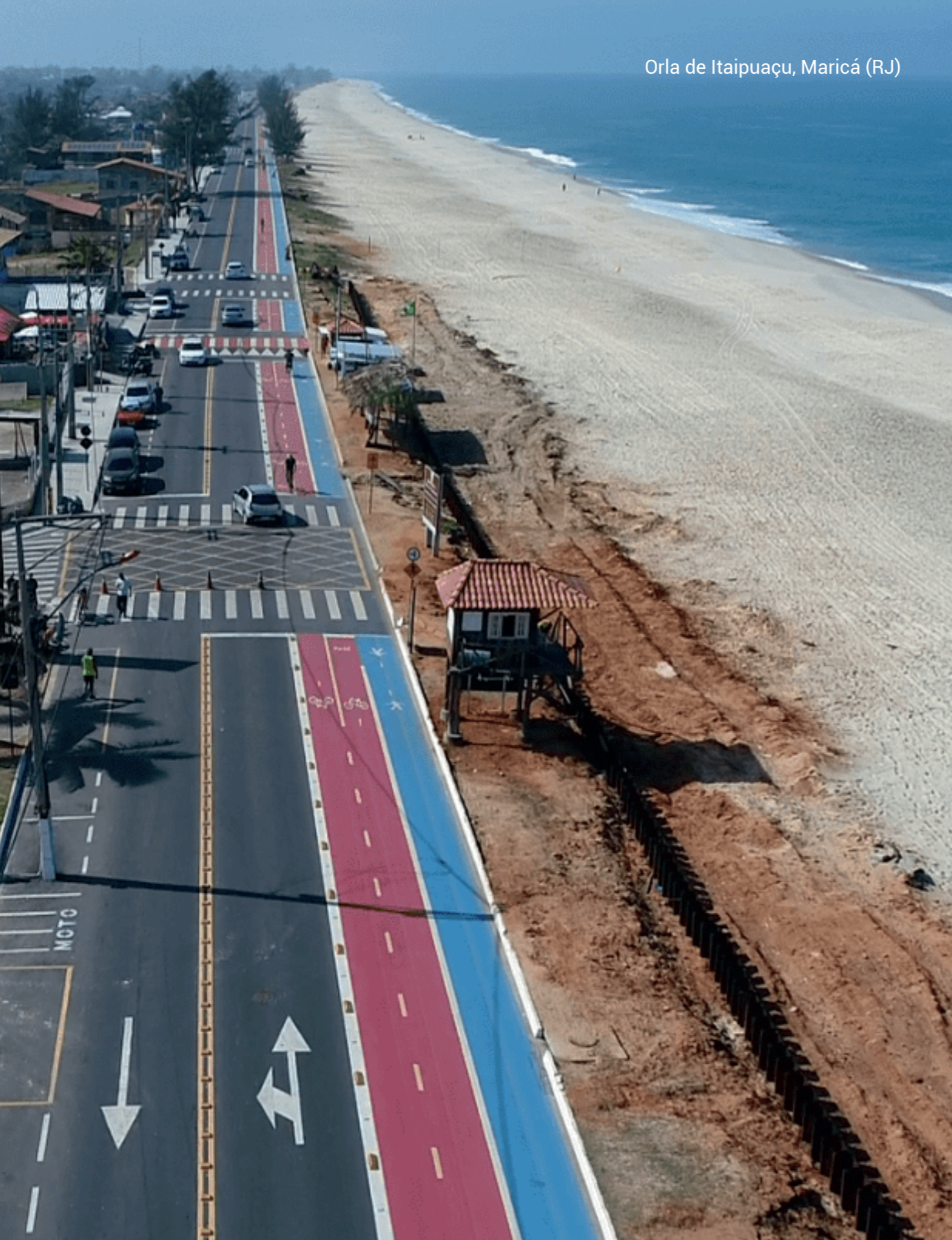
Orla de Itaipuaçu, Maricá (RJ)