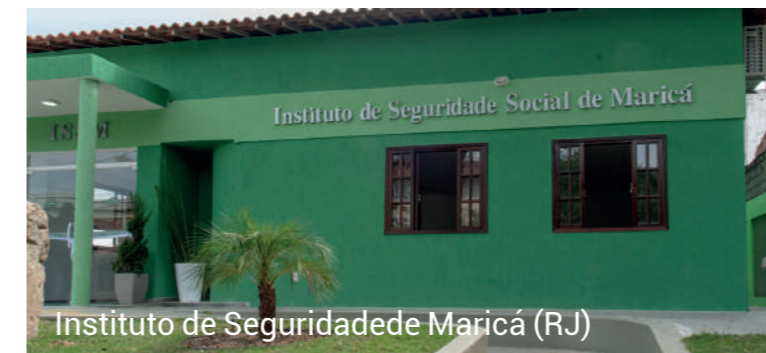
Instituto de Seguridade Social de Maricá (RJ)